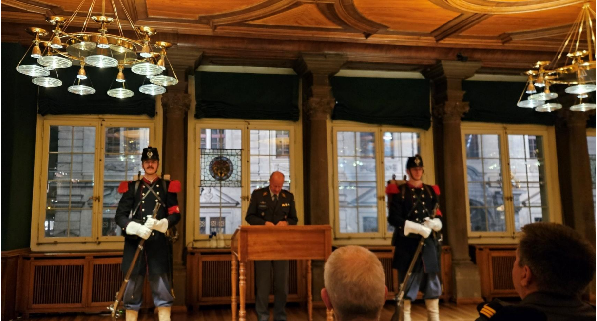
Bild Jubiläum, 150 Jahre der Zürcherischen Winkelriedstiftung.