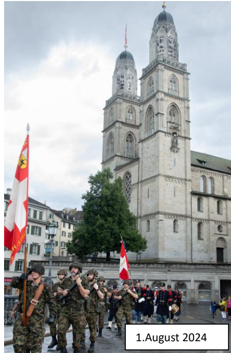
1. August 2024